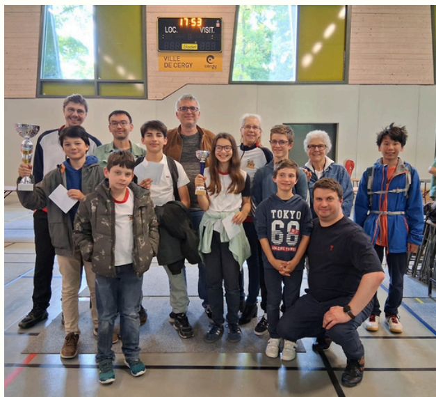
Photo de famille au Rapide de Cergy