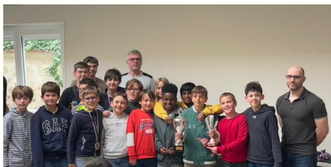
Les élèves du collège Notre Dame fêtent le prix de la meilleure école.